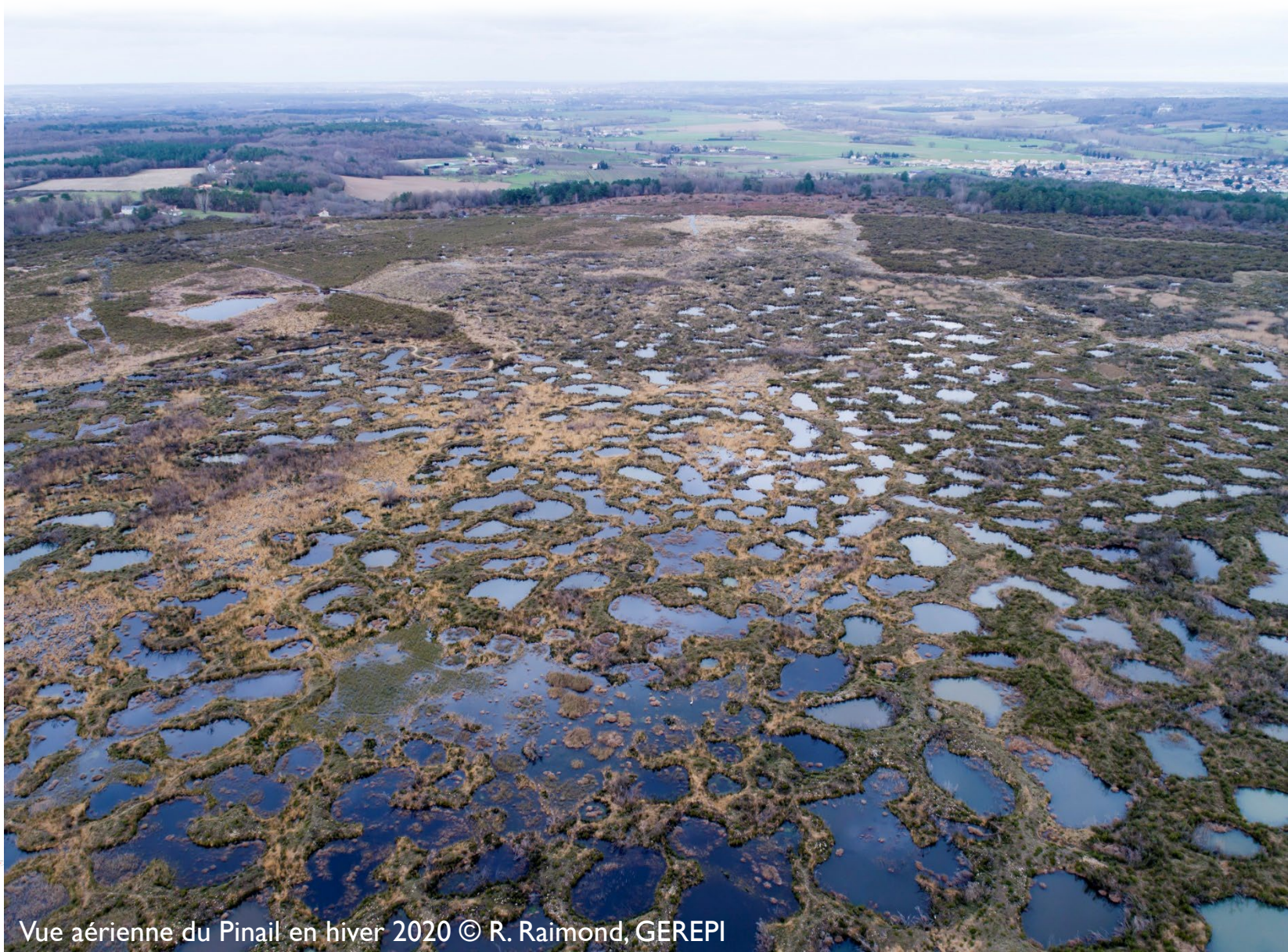
Vue aérienne du Pinail en hiver 2020