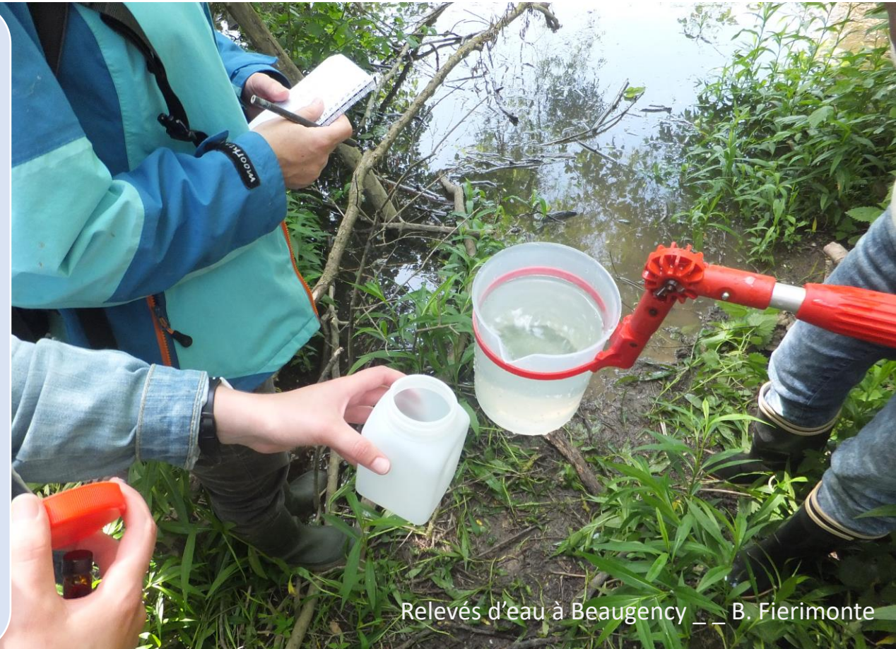
Relevés d'eau à Beaugency __ B. Fierimonte