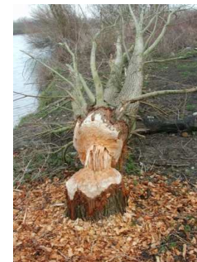
Traces de castor