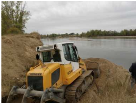
phase travaux été 2009