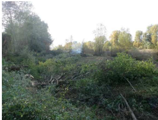
phase travaux été 2009