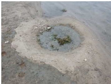
Frayère à sandres, 11 avril