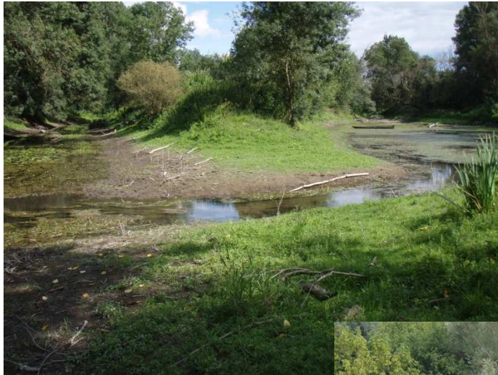
St Germain/Vienne 2005