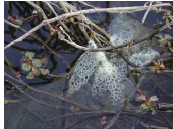
Fraie de perches communes, 2 avril