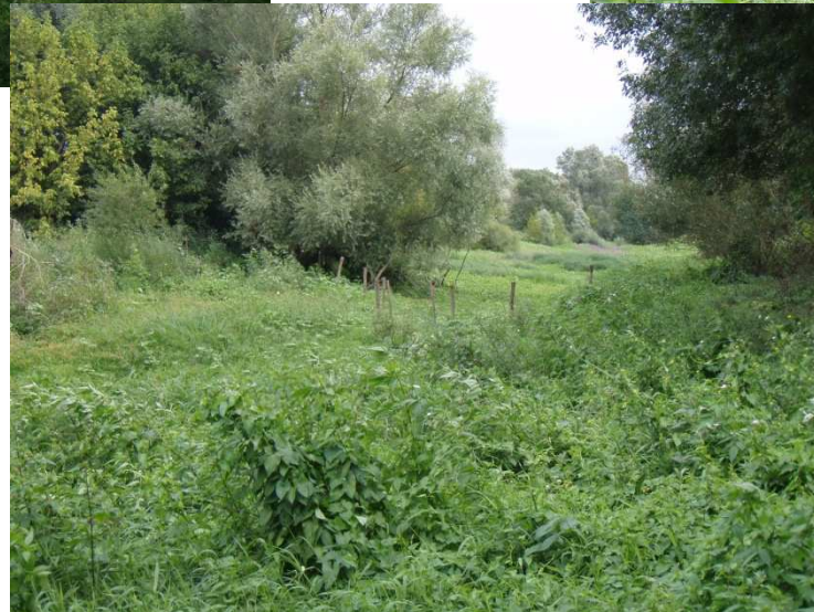
Sazilly, restauré en 1997