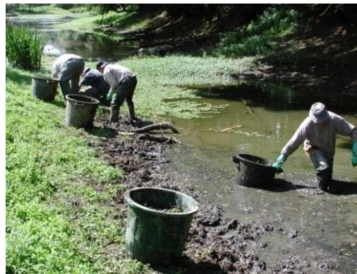
La gestion des plantes exotiques envahissantes