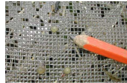
Œufs de brochets fin février début mars