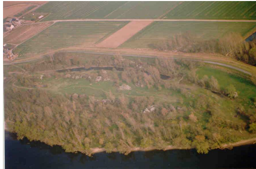
Rétablir la connexion