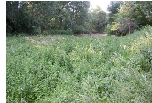
L'ouverture du milieu