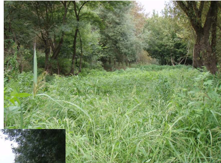
Rivière, restauré en 2006