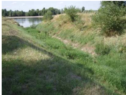
Avant travaux été 2009