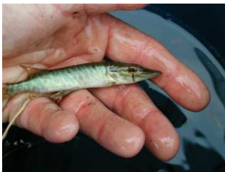
Espèce repère : le brochet