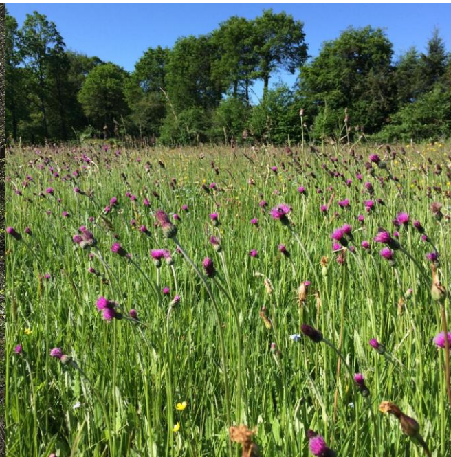
Prairies « naturelles »