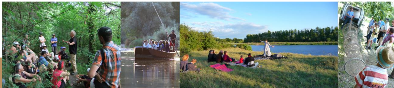
Journée technique « Caractérisation des têtes de bassin versant » – 05 septembre 2018, Montluçon