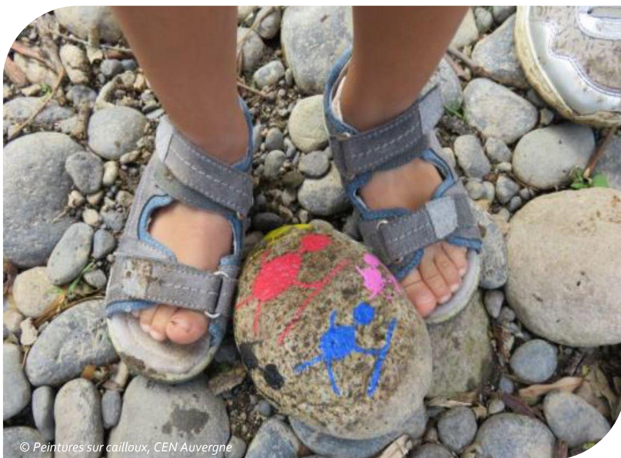
© Peintures sur cailloux, CEN Auvergne