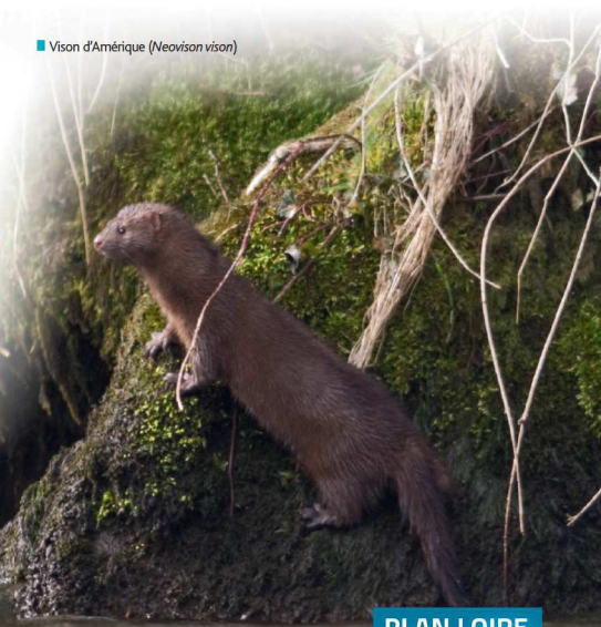
■ Vison d'Amérique ( Neovison vison )

Il entre directement en compétition avec le vison d'Europe en occupant une niche écologique semblable et les mêmes habitats. Le vison d'Amérique est également porteur du virus responsable de la maladie aléoutienne, facteur de mortalité important chez l'espèce européenne.