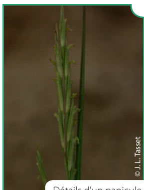
Détails d'un panicule

Graminée vivace formant des touffes denses, originaire d'Amérique du Nord.