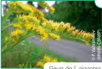
Fleurs de S. gigantea

Plantes herbacées vivaces, originaires d'Amérique du Nord, atteignant 0,5 à 1,5 m de haut.