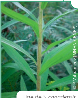
Tige de S. canadensis

Feuilles glabres ou ciliées au bord, vert-bleuâtre sur la face inférieure