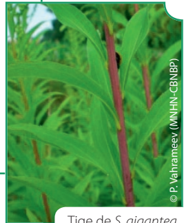
Tige de S. gigantea

Tige verte, velue, au moins dans sa partie supérieure