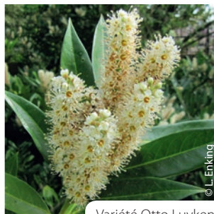
Variété Otto Luyken

Il existe de nombreuses variétés de Prunus laurocerasus cultivées, toutes ne présentent pas de tendance à l'invasion. Les variétés « caucasica » et « Otto Luyken » semblent être les plus couramment commercialisées.