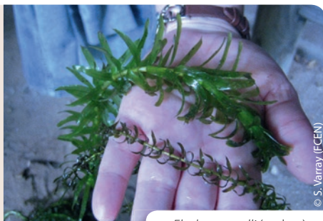
Elodea nuttalli (en bas)