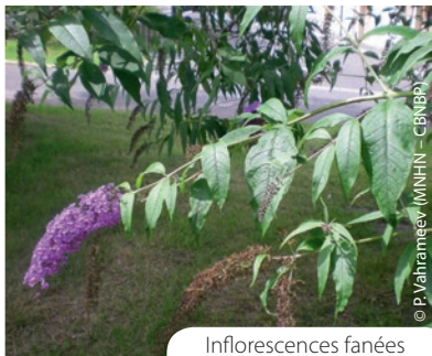
Inflorescences fanées persistant longtemps

Graines dispersées par le vent, l'eau et l'homme. Multiplication également possible par bouturage de fragments de tige.