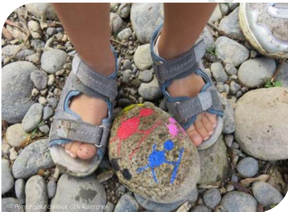
© Peintures sur cailloux, CEN Auvergne