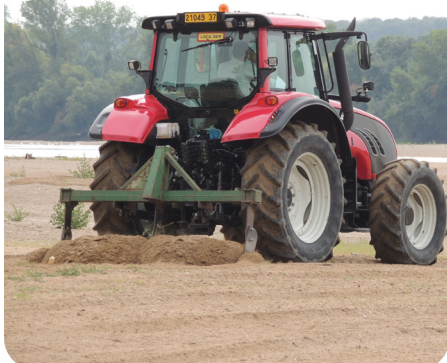
Traitement par sarclage des poussettes annuelles de ligneux sur grève exondée