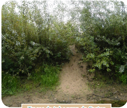
Traces de toboggan de Castor

Grâce à cette concertation multi-acteurs, 1 îlot de 10 ha en cours de colonisation par la saulaie-peupleraie est laissé sans intervention en zone de quiétude / zone d'alimentation pour le Castor d'Europe depuis 2018.