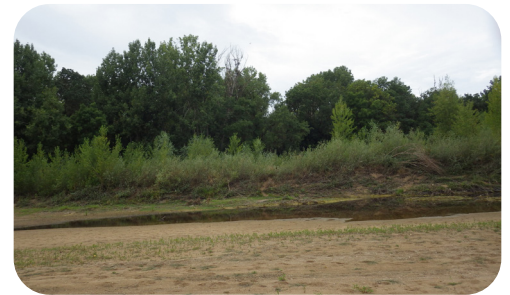
Semis de peupliers au premier plan et travail d'érosion de la Loire au second plan

Enfin, les modalités de suivi scientifique mériteraient d'être améliorées, de même que les échanges entre gestionnaires et chercheurs tout le long de la Loire. Un rapprochement avec les chercheurs de la Zone Atelier Loire serait à envisager. Le groupe de travail s'interroge notamment sur les modalités de suivi des travaux localisés d'entretien du lit, en lien avec la mobilité des sédiments (améliorer le suivi des déplacements des grèves par prise de points gps avant/après travaux, pour mieux évaluer l'effet localisé des travaux sur la dynamique de la Loire). Il s'interroge d'autre part sur l'évaluation des effets à long terme, y compris positifs, des modes d'entretien du DPF sur le maintien de la mosaïque géographique et temporelle des habitats naturels du lit de la Loire, y compris les végétations herbacées annuelles des grèves (risque de banalisation de la flore vs maintien d'une capacité d'expression par le rajeunissement du milieu).