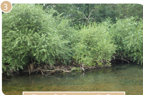
Terrier de Castor sous Saules

L'action bénéficie des suivis et moyens déployés dans le cadre de l'animation du site Natura 2000. Ainsi, la LPO Anjou, partenaire du Parc, assure notamment un suivi récurrent des oiseaux nicheurs des grèves de Loire en période de nidification . Elle réalise également, pour cette action, des prospections ciblées sur le Castor d'Europe afin d'identifier annuellement les zones sensibles pour l'espèce.