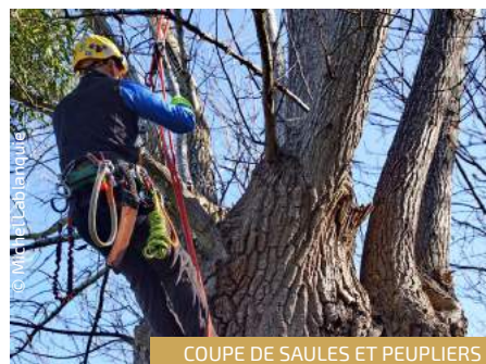
COUPE DE SAULES ET PEUPLIERS

Une exploitation des peupliers restants (plus jeunes sur un hectare) sera à prévoir dans un nouveau plan de gestion 2022-2026.