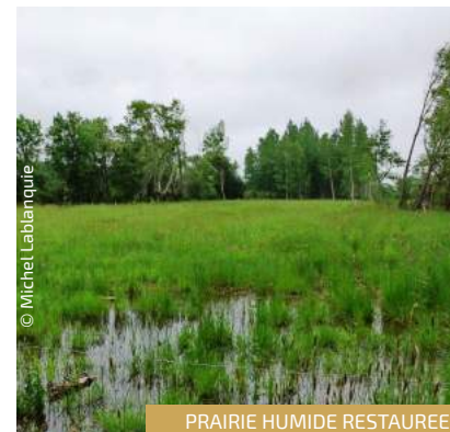
PRAIRIE HUMIDE RESTAUREE