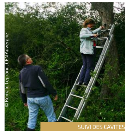
SUIVI DES CAVITES

En 2018, une session de sciences participatives Spipoll (Suivi des insectes pollinisateurs par photographie) a été organisée par le Museum National d'Histoire Naturelle.