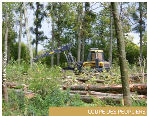
COUPE DES PEUPLIERS