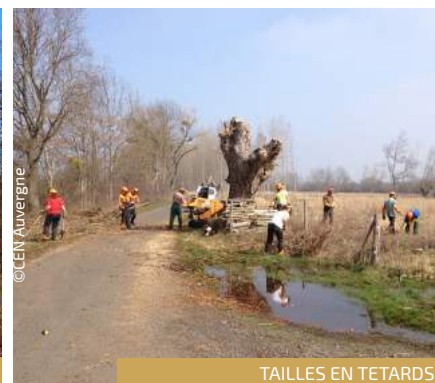
TAILLES EN TETARDS