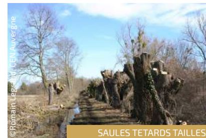
SAULES TETARDS TAILLES