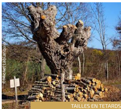
TAILLES EN TETARDS