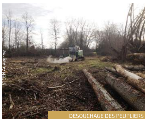
DESOUCHAGE DES PEUPLIERS