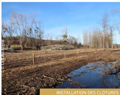
INSTALLATION DES CLOTURES

Le plan de gestion (2013-2017) fixe la ligne de conduite et les financements pour 5 ans. Les moyens mobilisés sur ce secteur ont été de 22 723 € pour la coupe, la pose de clôtures et la création des mares et de 15 161 € pour les arbres têtards.