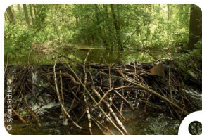
Barrage de castor

Le castor est nocturne et crépusculaire, il passe l'essentiel de ses journées dans son gîte à dormir et à se toiletter. Puis, la nuit tombée, il sort pour se nourrir, marquer son territoire et entretenir ses ouvrages comme les barrages et les huttes. Cette capacité de bâtisseur lui confère le surnom d'« ingénieur des écosystèmes ».