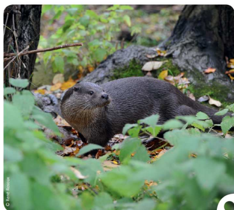
■ Loutre d'Europe

Pelage : marron foncé avec une gorge grisâtre et parfois quelques taches blanches